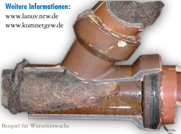
Beispiel für Wurzeleinwuchs

Hermens Haustechnik ist für die Dichtheitsprüfung ausgebildet und zertifiziert: